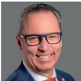
Moderation: Roland Blättler, Kantonal- präsident SVP Nidwalden